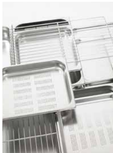
FOURS MIXTES RETIGO VISION – RÉCIPIENTS DE CUISINE

Le panneau de commande reste toujours du côté gauche du four mixte.