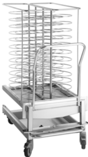
FOURS MIXTE RETIGO VISION + BANQUETING

Les fours mixtes Retigo Vision 1011, 2011, 1221, 2021 peuvent être utilisés avec un système de distribution des plats pendant un banquet. Il suffit de préparer sur des assiettes des plats ayant subis le refroidissement rapide ou des plats frais. Ensuite, en fonction des plats, vous recouvrez le chariot d'un dispositif thermique spécial toute de suite ou immédiatement après la régénération des mets. La housse thermique maintient la température des plats à distribuer pendant presque 25 minutes.