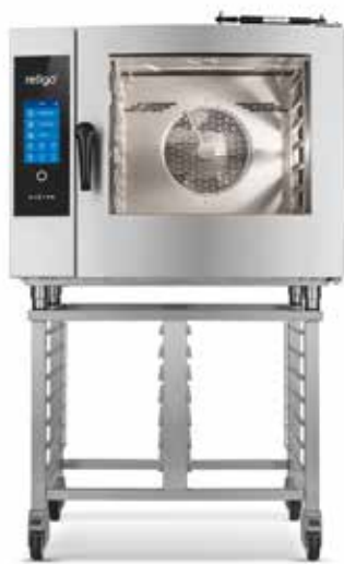
FOURS MIXTES RETIGO VISION – VERSION MARITIME, TRAIN

Le diamètre d'une assiette est de 280 mm et l'écartement entre des cercles est de 62 mm (plus d'assiettes à introduire) ou 80 mm (moins d'assiettes à introduire).