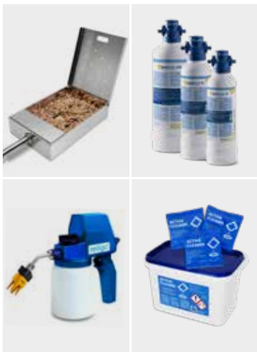
FOURS MIXTES RETIGO VISION – D'AUTRES ACCESSOIRES

Notre gamme intègre des récipients classiques en inox, pleins ou perforés, des récipients spéciaux, des grilles atypiques et encore des plaques émaillées. Pour plus d'informations, veuillez consulter le site www.retigo.fr .