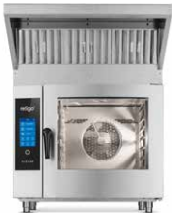
FOURS MIXTE RETIGO VISION + HOTTE A CONDENSATION VISION VENT

Les hottes à condensation Vision Vent peuvent être installées sur des fours mixtes électriques indépendants ainsi que sur des ensembles variés des fours mixtes électriques.