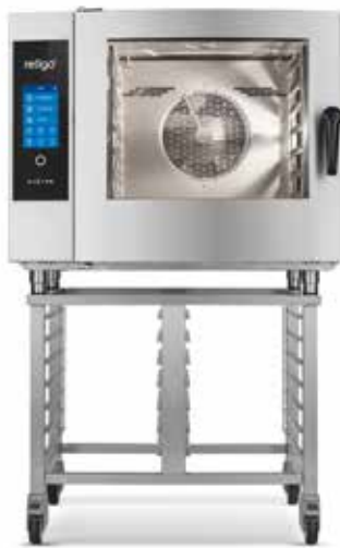
FOURS MIXTES RETIGO VISION – INVERSION DE SENS D'OUVERTURE DE PORTE

De manière standard, les fours mixtes Retigo Vision s'ouvrent du gauche à droite (les charnières de porte sont situées à droite). Cependant, les fours mixtes 623, 611 et 1011 peuvent s'ouvrir de manière inverse, si la disposition de la cuisine l'exige.